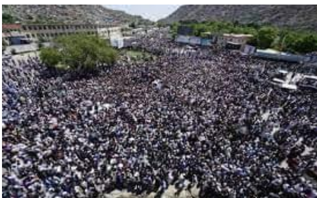
میدان دهمزنگ: اجتماع برای یک مظاهره و دادخواهی به نام جنبش روشنایی در سال ۱۳۹۵

روی هم رفته میدان دهبوری نیز از استقامت مهمی برخوردار است، وصل کوتاه سنگی از جانب غرب و وصل دانشگاه کابل از سمت شمال شرقی و مستقیم وصل ساختن سمت شرقی با میدان دهمزنگ که حوزه مستقیم کاری را نیز نشان میدهد و سمت شمال و جنوب را به ویژگی های کاربری خاص تبدیل می کند. بنابراین؛ رویکرد تحقیق در این دو میدان می تواند احیای دوباره ببخشد و کیفیت را ارتقا ببخشد.